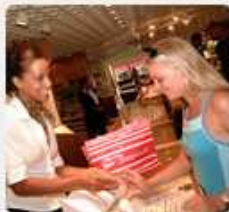
In un negozio duty-free di Philipsburg

Pensate che una vacanza ai Caraibi sia spiagge incontaminate, mare trasparente, musica e sport? Sbagliato! Una vacanza ai Caraibi è questo e molto altro! Sono molteplici le sfaccettature caraibiche su cui poter contare e tra questi sicuramente si annoverano boutiques e casinò .