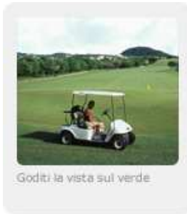
Goditi la vista sul verde.

legno e acciaio Classic Yacht , mentre a giugno va in scena l' American Sailing Week , con un ricco programma di corsi, gare e gite in barca.