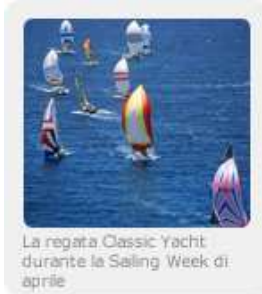
La regata Classic Yacht durante la Sailing Week di aprile.

Per ulteriori informazioni: www.antigua-barbuda.com