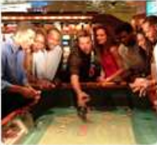
Divertimento al tavolo da gioco

Che cerchiate oggetti di artigianato o prodotti firmati, i Caraibi vestono nuovamente gli storici panni di centro nevralgico del commercio e si mettono a disposizione dei viaggiatori, anche i più esigenti: un viaggio che vi porterà tra la produzione locale per scoprire, tra gli altri, i preziosi monili disegnati dai maestri orafi di Holetown, St. James (Barbados) o nelle stradine caratteristiche di Carlotta Amalie, capitale di St. Thomas (USVI) oppure alla ricerca di ottimi affari nei grandi centri commerciali sparsi in tutte le isole, grazie ai vantaggiosi sistemi di tassazione duty free.