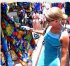
Al mercatino all'aperto di Marigot

FOCUS: Casino e Shopping a US Virgin Island Shopping & Nightlife a Barbados